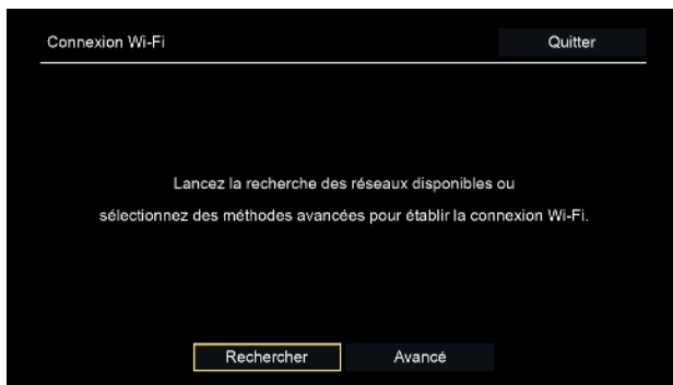
Illustration 4 : Configuration Wi-Fi