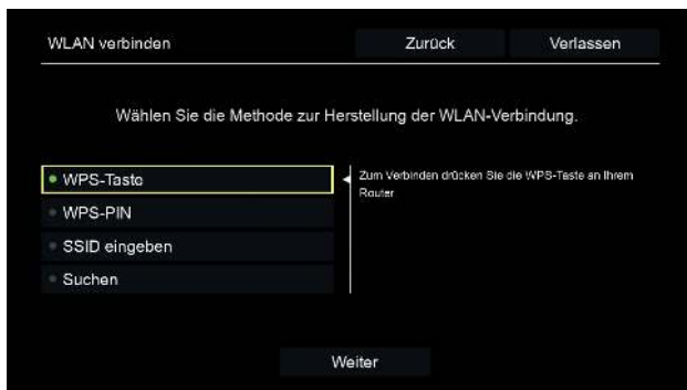
Illustration 6 : Configuration avancée du Wi-Fi