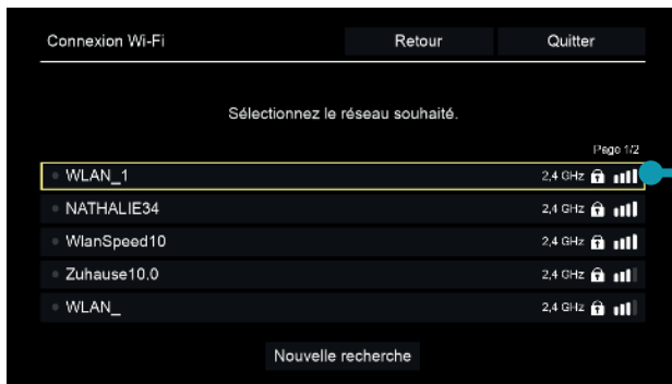
Illustration 5 : Wi-Fi disponibles