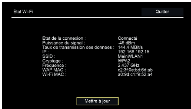
Illustration 7 : Aperçu état Wi-Fi

Dans le menu État Wi-Fi , vous pouvez consulter les données actuelles de votre connexion Wi-Fi telles que, par ex., la puissance du signal ou l'adresse MAC de l'adaptateur Wi-Fi.