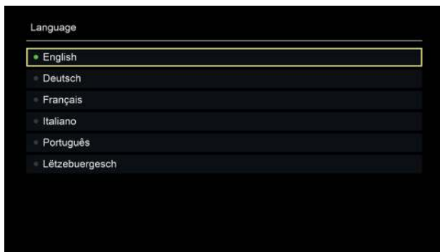
Illustration 3 : Sélection langue